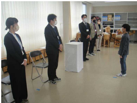
新任式児童代表「歓迎の言葉」

新しい職員を迎える新任式では、代表児童が堂々と歓迎の言葉を述べ、堀越小学校の良いところなどを紹介しました。その後、1学期始業式では学級担任が発表され、各教室で子どもたちと先生との出会いにより、新年度がスタートしました。これから1年間、子どもたちの成長が楽しみです