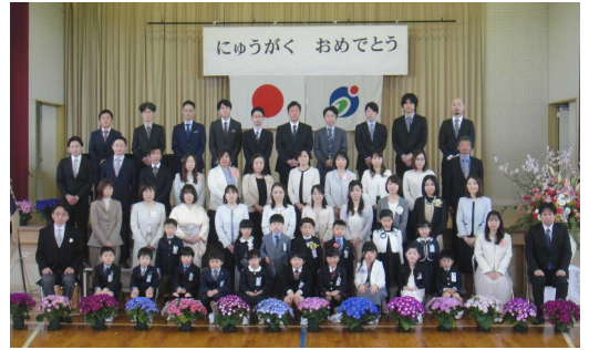
入学式後に「ハイ、ポーズ！」

4月7日（木）に入学式を行いました。感染拡大防止のため、参加者は保護者（各家庭2名以内）、5・6年生児童、学校職員に制限させていただきました。そのような中でも、入学式を迎えた1年生の態度はとても立派でした。呼名された時の返事、話を聞く姿勢、入退場する歩き方等、一つ一つがピカピカに輝いていました。少しずつ小学校に慣れて、楽しい学校生活を送ってほしいと思います。