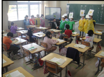
2年国語「ふきのとう」