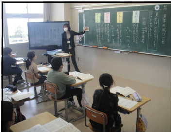
5年国語「漢字の成り立ち」