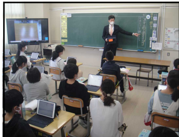
6年国語「漢字の形と音・意味」