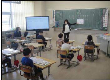
1年国語「ひらがな、あいうえお」

今年度、最初の学習参観が4月23日（金）にありました。たくさんの保護者の皆様からおいでいただき、ありがとうございました。子どもたちは、緊張しながらも、がんばっている姿を見てもらおうと一生懸命でした。子どもたちの眼がキラキラ輝いていました。