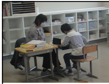
チャレンジ1 国語「漢字の成り立ち」