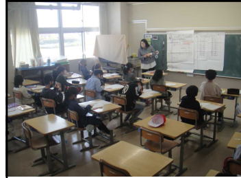
3年算数「かけ算のきまりを見つけて」