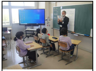
チャレンジ2 算数「文章問題（カルタ）」