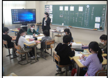
4年国語「漢字の組み立て」